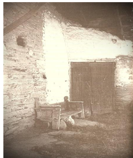
En Parada do Caurel hai o escano baleiro de Uxío Novoneyra - James Sacré

Un espectáculo que ao igual que o título logra asombrar ao público, fascinándoo polo frescor impactante da proposta.